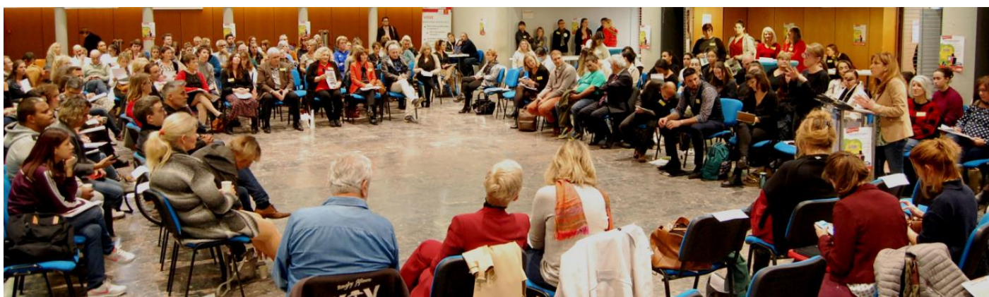
Les deuxièmes Assises Audoises du Handicap, le 18 novembre 2022.